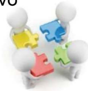
Redes de aprendizaje colaborativo