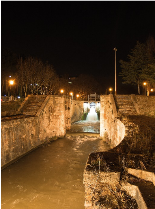
Esclusas del Canal Imperial en Zaragoza