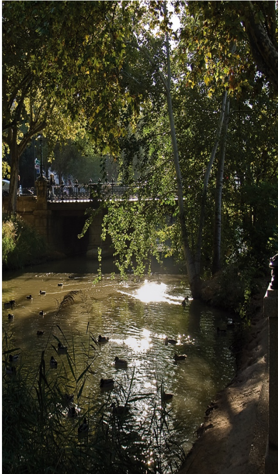
El Canal Imperial a su paso por Zaragoza